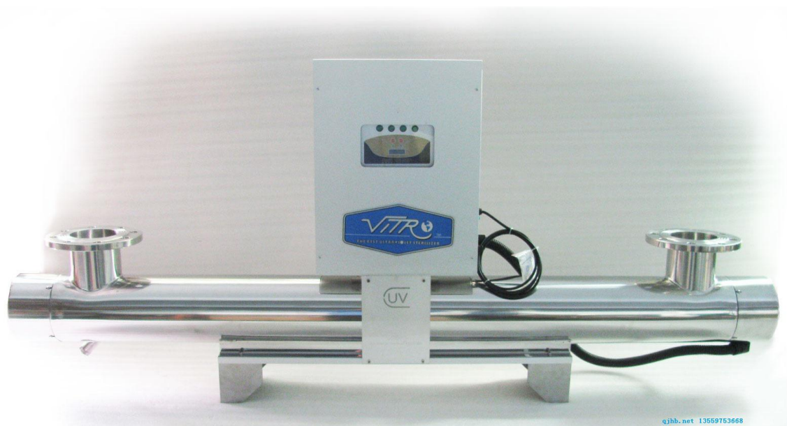
FS-500 品字形电箱 紫外线杀菌器

此选型表可能会因厂家设计原因而有所改进，尺寸等有所变化，恕不另行通知，以采购时咨询仟净厂家为准。根据进水水质不同，选用的型号不一样，如自来水建议选偏大一个型号，纯净水可以按标准来选型，由于污水处理设备当中，细菌较多，可以选用大一点的。