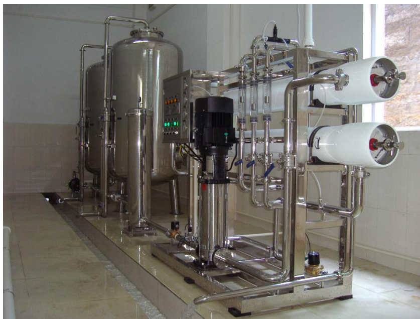
BT-4000 型去离子水设备（管道及前置过滤可选择不同材质）